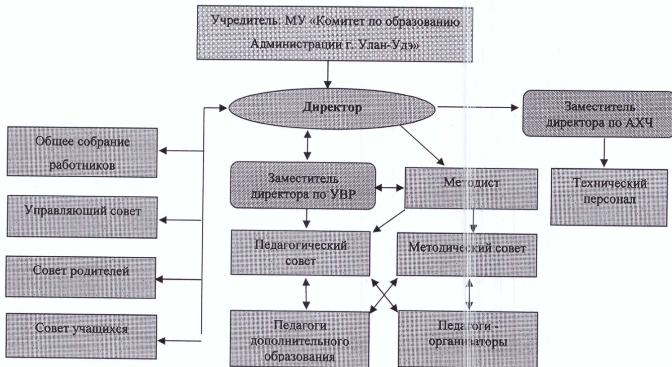
Схема структуры управления МБУ ДО ДЮЦ «Безопасное детство»

В Учреждении разработаны внутренние локальные акты: